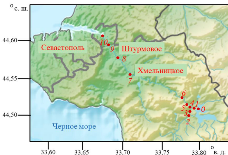
Рис. 1. Расположение станций многолетнего мониторинга р. Черной: ст. 0 – зеркало водохранилища над водозабором; ст. 1 – водозабор под водохранилищем; ст. 2 – р. Байдарка, бывший ставок; ст. 3 – водопропускная труба под автомобильной дорогой в с. Озерное; ст. 4 – р. Уркуста (приток от ставка с. Передовое); ст. 5 – автомобильный мост с. Озерное – с. Передовое; ст. 6 – гидропост у Красной скалы; ст. 7 – гидропост у с. Хмельницкое; ст. 8 – автомобильный мост у с. Штурмовое; ст. 9 – ж/д мост у Инкермана; ст. 10 – автомобильный мост у Инкермана

Район отбора проб. В ходе выполнения мониторинга состояния загрязнения вод р. Черной и Чернореченского водохранилища с 2010 по 2014 г. отобрана 551 проба, а в период 2015–2020 гг. – 787 проб речной воды для определения содержания в них соединений неорганического азота, неорганического фосфора и кремнекислоты. Экспедиционные работы проводились ежеквартально и являлись частью работ государственного задания Морского гидрофизического института (МГИ) РАН (рис. 1).